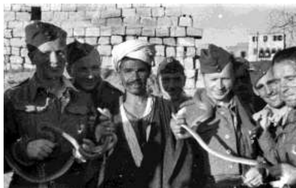
Lengyel katonák egyiptomi állomásozása, a 2. világháború idején

gyel hadtest katonái Jaroslaw Sagan parancsnok kezdeményezésére „Múzeum a hátizsákban” jelszóval gyűjtésbe kezdtek. A katonák pénzüket áldozva tárgyakat vásároltak vagy cigarettájukat cserélték műtárgyakra a kairói Egyiptomi múzeumban, piacon, vagy éppen neves egyiptomi régészektől vásároltak. Csodálatos az a pontosság, amellyel az egyes tárgyakat egy készletkönyvben regisztrálták, minden elemet leírással, rajzzal vagy fényképpel ellátva. Érdekes módon a katonák nem vásároltak hamisítványokat. Sokszor ellenséges tűz alatt csomagoltak és szállították a dobozokat, hogy megvédjék az értékes tárgyakat a pusztulástól.