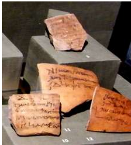
Néhány osztrakon a kiállításról

értelemben vett pénzérmekek csak a Kr.e. 4. században jelentek meg. Előtte deubenben számoltak. (1 deben 91gr ezüsttel volt egyenlő.) Egy véletlen felfedezésnek köszönhetően kiderült, hogy két osztrakont (Krakkóból és Bécsből) egy kézzel írtak.