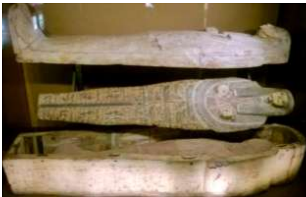
Neszi Honszu koporsó-együttese