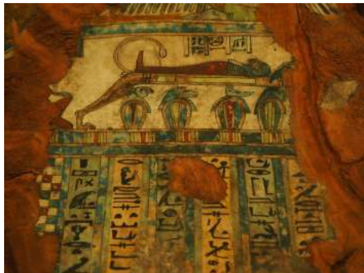
Részlet Iszet-iri-khet-esz koporsójáról

osztatú, arany csíkozású parókat visel, a vállak vörös alapon sárgával pettyezettek, alatta szárnyas szkarabeusz. A hétsoros nyaklánc alatt Ízisz istennő térdpel szárnyait kitarva, fején napkoronggal. A következő regiszterben három istenség, középen Ozirisz atef -koronával, heqa -jogaral és ostorral. A függőleges oszlop közepén egy arany sáv húzódik, oldalain két-két Hórusz fiúval. A múmia lábát festett szandálokkal díszítették. Csak a talpon lévő csíkozás maradt meg.