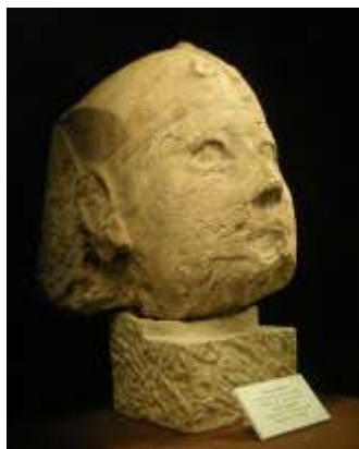
V. Ptolemaiosz szobrának a feje

A fal melletti vitrinek sorában egy fáraó fej látható, amit Szakkarában találtak. Csíkos nemezkendőt visel, közepén ureusz kígyóval. Sajnos nem hordoz olyan jeleket, amivel konkrétan meg lehetne határozni tulajdonosát. Feltételezhető, hogy egy szfinx szobornak a feje lehetett, a Ptolemaiosz kori szfinxszobrászathoz való hasonlóság alapján.