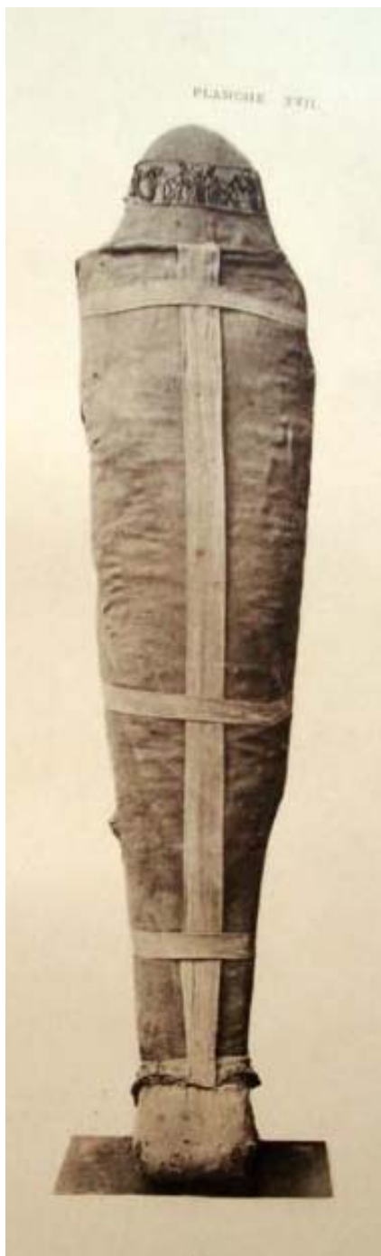
III. Ramszesz érintetlen múmiája

A dátumokat megvizsgálva szembetűnő, hogy I. Pinodjem (Kr. e. 1070-1032) alatt egy bizonyos 6. évtől megsaporodnak a különböző újrapólyálások, és az érintett személyeket legtöbbször a saját sírjukba temetik újra, de ekkor nyilvánvalóan már nem díszes koporsóban, és gazdag mellékletekkel.