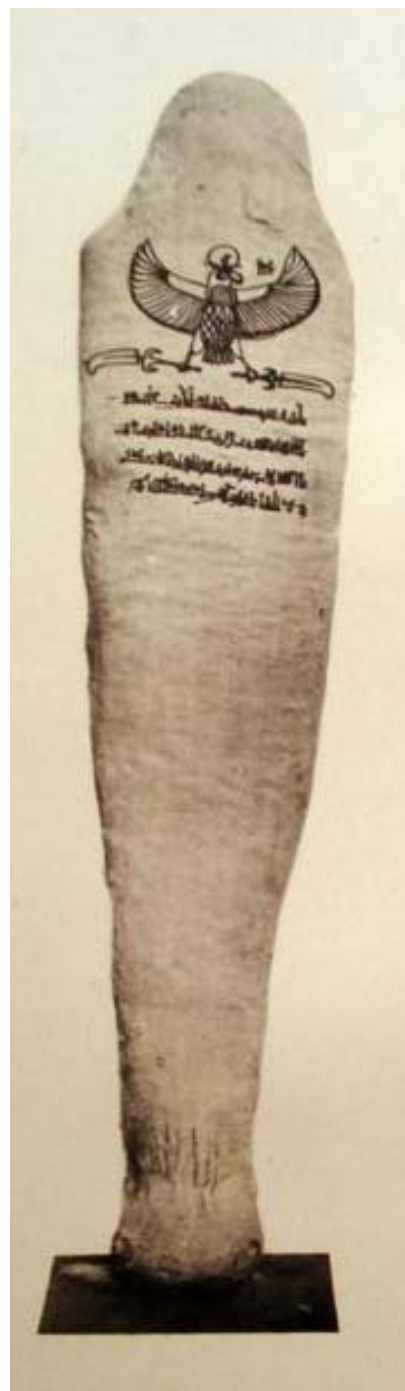
III. Ramszesz múmiája a külső borítás levétele után

A levelek közül témánkhoz leginkább a BM 10375-ös számú papiruszon található levél (LRL 28) kapcsolódik, amely a wHm mswt periódus 10. évé-