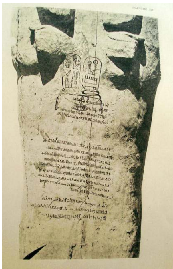
I. Széthi koporsófedele