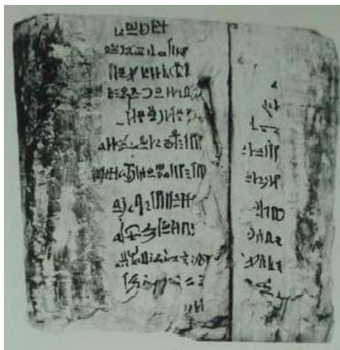
I. Ramszesz koporsótöredéke

gasan (qAjj = „magas hely”) fekszik Deir el Bahariban. Újabb vizsgálatok azonban arra az eredményre jutottak, hogy a sír kialakítása valószínűleg későbbre datálható. A három koporsót ugyanazon a napon helyezték el Inhapi sírjába, mint amelyen II. Pinodjem Amon főpapot eltemették a DB 320-ba, és csak később, I. Sesonq (a 22. dinasztia első uralkodójának) 11. éve után, temették őket el végső nyughelyükre,