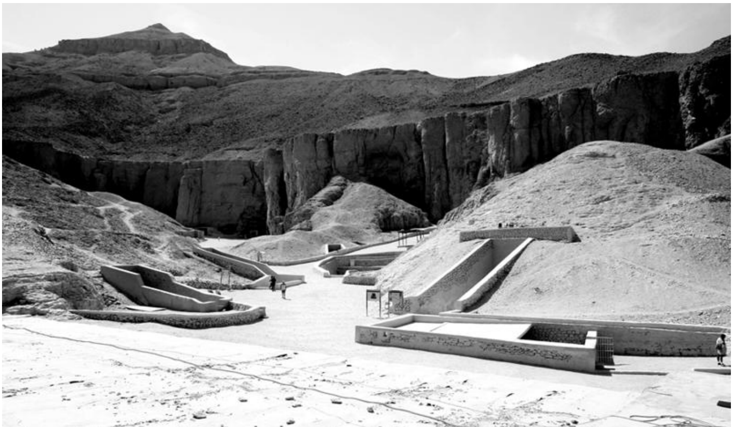
A Királyok Völgye – látkép

III. Ramszesz (Kr. e. 1184-1153), a korszak utolsó nagy fáraójának halála után a hadi zsákmányokból, adókból, és a külföldi kereskedelemről származó bevételek is jelentősen csökkentek. Ugyan a Sínai-félszigetre indított rézbányászati expedíciók abbamaradtak, a núbiai aranybányákból kitermelt arany még az uralkodók rendelkezésére állt. A Harris Papiruszból jól ismert, hogy III. Ramszesz értékes föld-