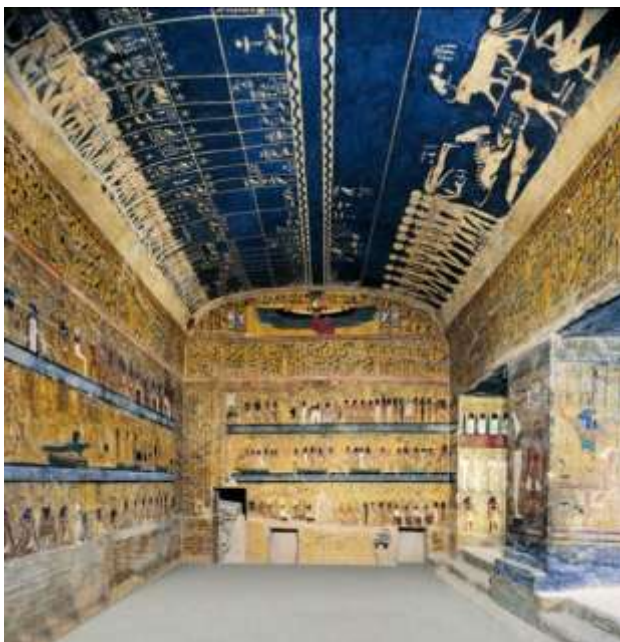
I. Széti fáraó sírkamrája a Királyok Völgyében

és megtaláltuk a király tiszteletreméltó múmiáját, a sólyom alakjával díszítve. Nagy mennyiségű amulett és arany ékszer volt a nyaka körül, és egy arany diadém volt fölötte. Ennek a királynak a tiszteletre méltó múmiája arannyal volt borítva, és szarkofágjait belül és kívül arany és ezüst díszítette és mindenféle értékes kövek berakásai. Mi összeszedtünk mindent, amit találtunk rajtuk, ami aranyból, ezüsből és bronzból volt, és elosztottuk magunk között. Az aranyat, amit ezen a két istenen találtunk, és az ő múmiájukról való amuletteket, ékszereket és a szarkofágok darabjait 8 részre osztottuk. Mindegyikünk 20 debent kapott, összesen 160 deben aranyat, nem számítva a rejtett hely töredékeit. Azután átkeltünk a folyón, és visszatértünk Thébába. Néhány nap múlva, Théba főkerületének főfelügyelője meghallotta, hogy betöréseket követtünk el a Nyugati Thébában. Bebörtönöztek engem Théba polgármesterének hivatalában. Ezután én fogtam a 20 debent, amit a zsákmány részeként kaptam, és odaadtam Ha-em-opének, a Théba kikötője melletti fogda írnokának. Ő elengedett engem, és én csatlakoztam társaimhoz, és ők kielégítettek engem egy újabb résszel. Így hát együtt a többi tolvajjal, akik velem voltak, folytattuk mostanáig az urak Thébától nyugatra fekvő sírjainak kirablását. És ennek a vidéknek sok lakosa folytat tolvaj mesterséget, úgy, mint mi, és ők a mi jó cimboráink.”