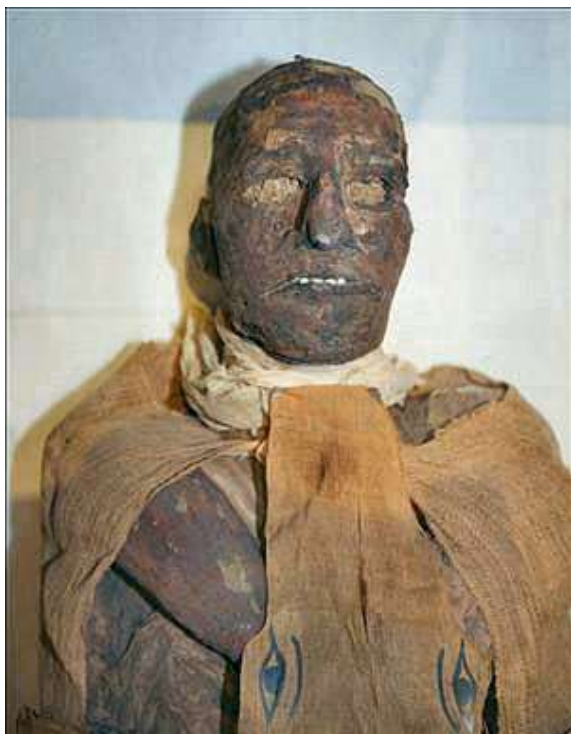
III. Ramszesz múmiája a pólyával

hogy a vétkek, amiket elkövetett halált érdemel- nének, önmagától halt meg.” Ezek a papirusz részletek arról tanúskodnak, hogy a hárem- összeesküvés veszélyes lehetett az uralkodóra nézve, de úgy tűnik, III. Ramszesz nem ebben halt meg. Lehetséges, hogy valami mérgezés végzett vele, de a múmiáját megvizsgálták és nem találtak erőszakosságra utaló nyomokat. Mindenesetre a legmagasabb rangú személyeket öngyilkosságra szólították fel, az alacsonyabb rangúakat elég kegyetlenül megkínozták. Már maga az orr és fülevágás is elég súlyos büntetés volt. De a vízbe fojtás is kegyetlen. Emellett volt, akit száz botütésre ítélték – ez 5 hatalmas, fájó, vérző sebet okozott az elítéltnak.