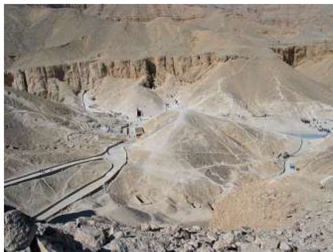
Királyok Völgye látképe

óriási válsággal küzdött, anyagi és erkölcsi értelemben egyaránt. Még annak a gyanúja is felmerült, hogy maguk a hivatali előljárók is részt vettek a sírrablásokban.