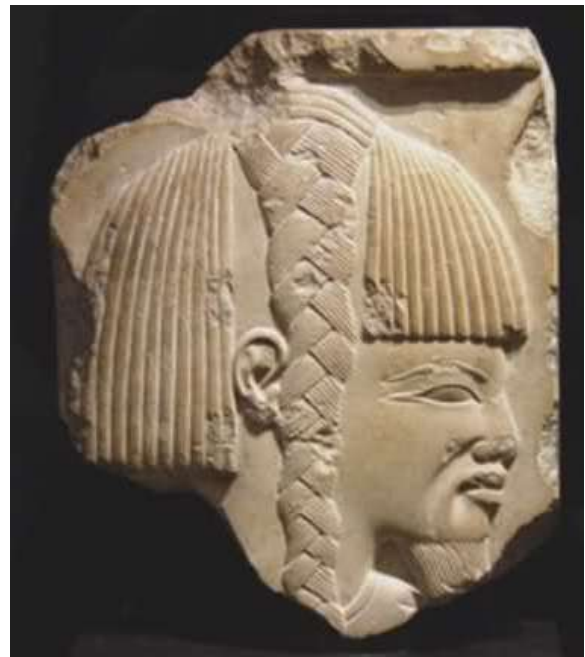
Líbiai feje II. Ramszesz halotti templomából

Az Újbirodalom nagy fáraóit nem érte ilyen sérelem, de bizony a 19. és 20. dinasztia fordulóján az ország válságos helyzetbe került. Nem csupán azért, mert a belső gazdasága meggyengült és megrendült, hanem mert ezzel egy időben kelet felől az indoeurópai népek vándorlása feltartóztathatatlanul jött, több hullámban egymás után követték egymást ezek a népek, és az útjukba eső országokat legázolták. Egyiptomnak már korábban is szembe kellett néznie betolakodókkal, de eddig még mindig szerencsésen szembeszállt velük. III. Ramszesz különösen nagy tetteket vitt végbe.