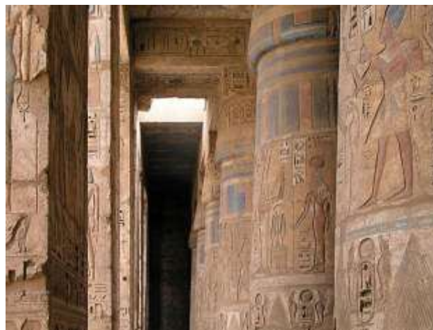
Medinet Habu, III. Ramszesz halotti templomának 2. oszlopcsarnoka

aztán már sokáig vártak, sokat ígértek nekik, de mégsem érkezett meg az ellátmány: az élelmi- szer, ruhanemű meg olajok. Ekkor kivonultak III. Thotmesz halotti templomához, leültek a földre és panaszkodtak. Az Amherst papirusz a következőképpen írja ezt le: „Ezen a napon az történt, hogy a munkások áthatoltak a temető 5 falán, és azt kiáltották: Éhesek vagyunk! Leültek III. Thotmesz temploma elé, a szántóföld és a sivatag határán. Három felügyelő és segédek sürgötték őket, hogy térjenek vissza a temető területére, és nagy esküt tettek: Visszatérhettek, szavát adta a fáraó! Mégis ott ültek egész nap, és csak estére tértek haza. Második nap hason- lóképpen tettek. A harmadik nap előzönlöttek a Ramesseumot, és így kiáltottak. Az éhség, a szomjúság, a nincstelenség űzött ide bennünket, nincs már olajunk, halunk, gabonánk. Tudasd a fáraóval, ami jó istenünkkel, és a vezírral, akik urunk, tegyenek valamit, hogy élhessünk. A 8. napon kapták meg a részüket.” Ez a világ- történelem első ismert sztrájkja, amelyet még több munkabeszüntetés is követett, de ezekről nincsenek ilyen részletes beszámolóink. Ahogy telt az idő, és a gabonaelosztás egyre szakado- zottabbá vált, az infláció pedig egyre magasabb- ra emelkedett, az emberek nem tudtak megélni. Egyre erőteljesebben követelték munkájuk bérét, de egyre kevésbé kapták meg.