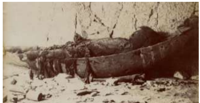
Széthnaht múmiája fahajóba helyezve, II. Amenhotep fáraó sírjában, ahogy Victor Loret megtalálta

Amikor Kr.e. 1071 körül vége lett a Rameszszida kornak, és az utolsó, XI. Ramszesz is eltűnt, akiről egyébként már teljes megvetéssel beszéltek, az ország kettészakadt. A déli részre, amelyet a hatalmas és gazdag luxori és karnaki Amon főpapok irányítottak, és északra, ahol Szmendész vette kezébe a hatalmat. A két király – a papkirály és fivére – jó kapcsolatokat ápolt, melyet kölcsönös házasodásokkal meg is őriztek. Az ő idejükben azonban a sírrablások olyan méreteket öltöttek, hogy a főpapoknak kellett beavatkozni a Királyok Völgyében. Így a kirabolt sírokból összegyűjtötték a királmúmiákat, és mások félreeső, titkosnak vélt sírjaiban helyezték el őket. Gyakran javították, restaurálták a múmiapólyákat, esetleg ajándékokkal is ellátták a halottakat. Szerencsére ezek közül elég sok épségben megmaradt.