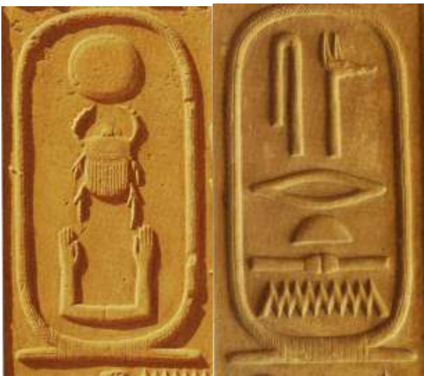
I. Szeszosztrisz fáraó kartusai a karnaki Fehér kápolnájából

Ennek a gyilkosságnak is köszönhető, hogy megszilárdult a Középbirodalom idején a társuralkodás rendszere, tehát minden uralkodó maga mellé vette az örökösét, többnyire a fiát és együtt uralkodtak. I. Szeszosztrisz, amikor meghallotta apja meggyilkolását, visszatért, és elégette a gyilkosságban részt vevő gonosztevőket. Ez is egy büntetési forma volt.