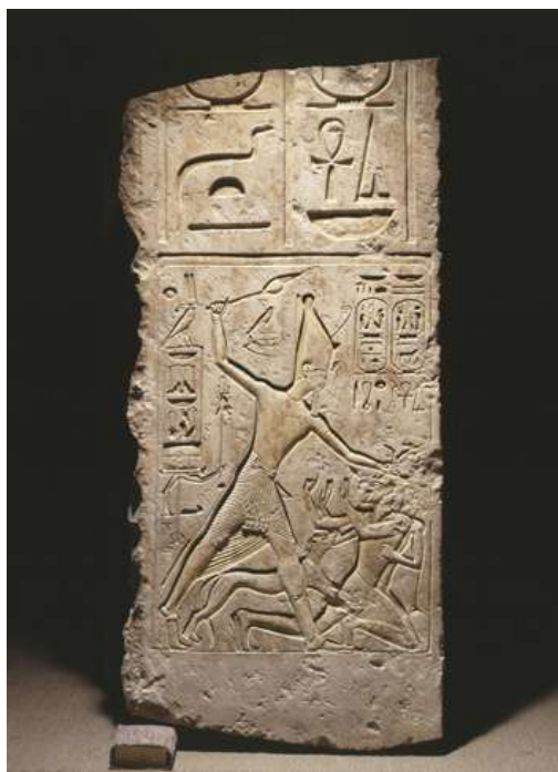
Merneptah fáraó lesújt az ellenségre. Memphiszi palotájának ajtófélfája (Pennsylvania Museum)