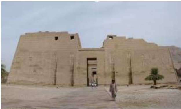
Medinet Habu, III. Ramszesz halotti temploma

a foglyul ejtett ellenség levágott kezeit. A zsákmányt, a templomokban amúgy is rendszeresen és gondosan felsorolták. Az igazi nagy próba-tétel a tengeri népek három egymást követő támadása volt, amelyet III. Ramszesz sorra visszavert. Ez mind a gazdaságot, mind az ország belső életét megrendítette, annak ellenére, hogy igen nagy zsákmány szerzett a fáraó. Mint halotti templomában elmondja, mintegy 40.000 élő marhából adományozott 30.000-et a thébai Amon papságnak.