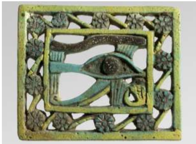
Udzsat szem amulett (Szépművészeti Múzeum)

Amuletteket többnyire láncra fűzve, nyakba akasztva szokás viselni, de például Egyiptomban ma is találni olyan embereket (főleg asszonyokat és gyerekeket), akik apró táská formájú bugyorba rejtik amulettjüket, és azt hordják zsinórra kötve magukkal. Hasonló lehetett a helyzet az ókori Egyiptomban is, csak ott a halottakat is bőségesen ellátták amulettekkel, hiszen az ő túlvilági életükben is szükség volt védőerőre. Ők viszont felerősítés nélkül, egyszerűen a vászonrétegek közé helyezve is viselhették, tehát a halotti célra készített amuletteknél még kevésbé okozott gondot a