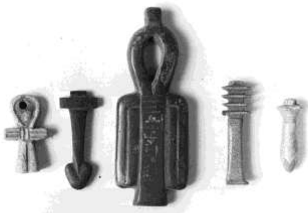
Anh, szema, tjet, dzsed és uadsz amulett (Szépművészeti Múzeum)

Mágikus erővel rendelkezettek miniatűr tárgyak és testrészek amulettjei is (Róluk szól Cl. Müller-Winkler, Die Ägyptischen Objekt-Amulette (Göttingen 1987) c. könyve). Izisz csomója például az istennő védelmét közvetítette. A Halottak Könyve 156. fejezete így ír róla: "Vörös jáspis tjet varázsigéje. XY, az igazhangú így szól: Tied a te véred, Izisz. Tied a te varázserőd, Izisz. Tied a te varázslatod, Izisz, az amulett, mely e Nagynak a védelmére szolgál. Megvédi attól, ki gonoszat tesz ellene. Mondd a szavakat jáspis tjet felett, mely henna nedvébe van mártva, szikomorfa rostjára felfűzve, és e megdicsőült halott nyakába téve a temetés napján. Ha ezt megteszik neki, Izisz varázserője lesz a teste védelme. "