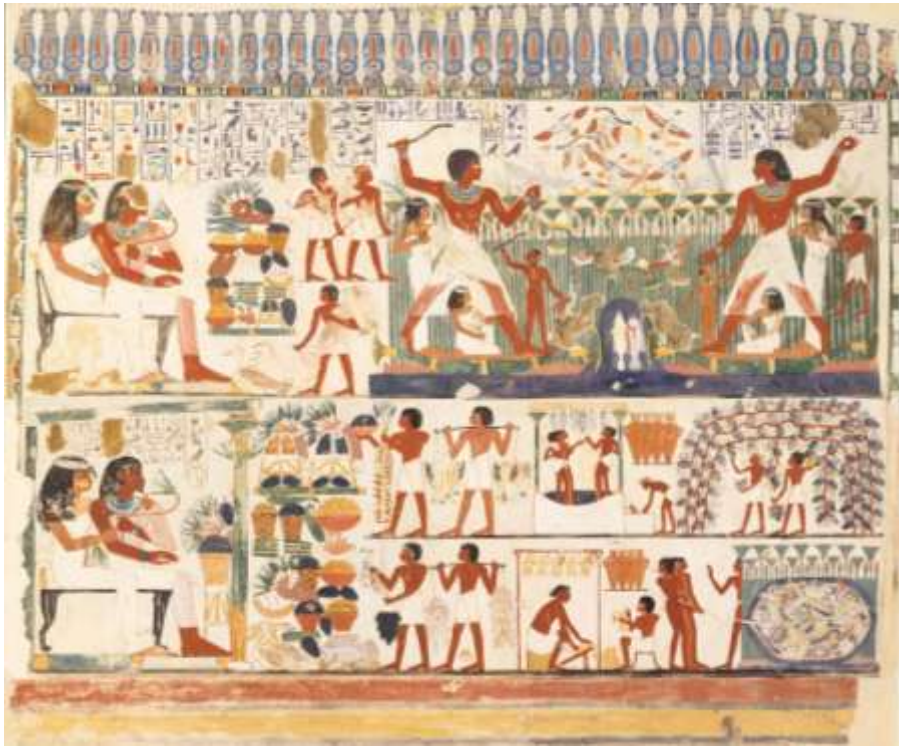
Részlet Nakht sírjából, Norman de Garis Davies másolata (Metropolitan Museum)

A taposók munkájukhoz kedvet, ütemet muzsikusok zenei kíséretéből merítették az Óbirodalomban, míg az Újbirodalomban a "talpalávalót" a taposók egyike adta egy, Renenutethez a szüret, aratás istennőjéhez szóló ének formájában. Taposással nyerték ki a bogycsók létartalmának 2/3-át, a maradékot (héjastul, magostul, kocsányostul) ún. zsákprésbe helyezték, miáltal a zsákprésből kifolyó musthoz hozzáadódott a héj, kocsány fanyarsága, színezőanyaga stb. A korszokba töltött must erjedését a nyári forróság szinte azonnal elindította, ami egyes ábrázolások szerint annyira heves is lehetett, hogy a lé a korszó pereme fölé habozva csapott ki. Még mielőtt az erjedés ecetesedésbe át nem fordult, kellett a korszokat lezárni, lepecsételni. A pecsétet a szalmatörökkel elkevert agyagdugaszba nyomták, s hogy az agyag ne hullhasson a borbá, a korszó szájára előbb egy kis kerámia tálkát helyeztek. A fővincellér a bor minőségét garantálva jelen volt a pecsételéskor, feliratozásnál, s az Újbirodalomban nevét is adta a hitelesítéshez.