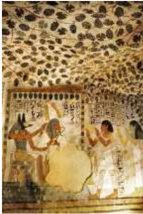
Részlet Szennefer sírjából (TT96)

Nem az egyén, hanem a királyság megújulását, fennmaradását, bőségét szolgálhatták viszont a 18-19. din. királyi kioszkjainak, balkonjainak kedvelt fürt motívumai. A királyi trón baldachinját is fürtök díszítették a természetábrázolásokat kedvelő Amarna korban. E korból, valamely épületelemről származhatnak a Múzeum kékfajansz, feltehetően öntömintán, tömegtermeléssel