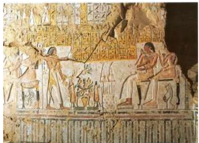
Részlet Thotmesz sírjából (TT32) a kis majommal

Ugyancsak az elhunytak túlvilági élelmiszer utánpótlását vélték biztosítani a sírfalakon megörökített mezőgazdasági munkákkal. Ezek közt csupán nagyvonalakban, mégpedig 12 szakaszra, jelenetre tagoltan követhetjük nyomon a bor előállítását. A 12, egyszerre és egy helyütt sehol nem ábrázolt munkafázis közül a leggyakrabban magát a kb. augusztus tájékán esedékes szüretet adták vissza. Pusztá kézzel, kosarakba szedték a korábban alacsonyabb, térdelve is elérhető, később embermagasságú lugasokra futtatott szőlőt. (A bor "irp" szó hieroglif determinatívuma 𓄀𓄁𓄂 is a 2 karon átfuttatott növényt mutatja.) A tűző nyári nap hevétől óvott, pálma – és szőlőlevelekkel lefedett kosarat ezután a taposó-kádhoz vitték. A taposókádban, amely az egész Mediterráneumban és a Közel-Keleten hagyományos módja volt a szemek összetörésének, a taposók egy keresztrúdra, illetve az Újbirodalomtól kezdődően az arról lelógó kötelekbe, indákba kapaszkodva tartották meg egyensúlyukat.